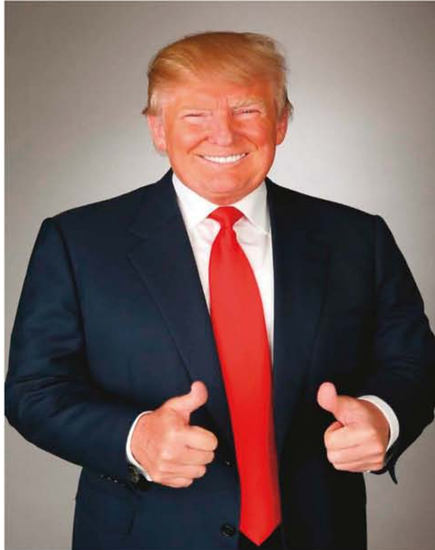
Donald Trump hat auch die Medien im Visier. Aus einem Leserbrief am Tag nach seiner Wahl in der Abendzeitung München: „Donald Duck wäre das kleinere Übel gewesen.“

Gibt es denn überhaupt eine potentielle gemeinsame Ebene für die USA und Russland? "Wenn wir ehrlich sind, steht selbst das gemeinsame